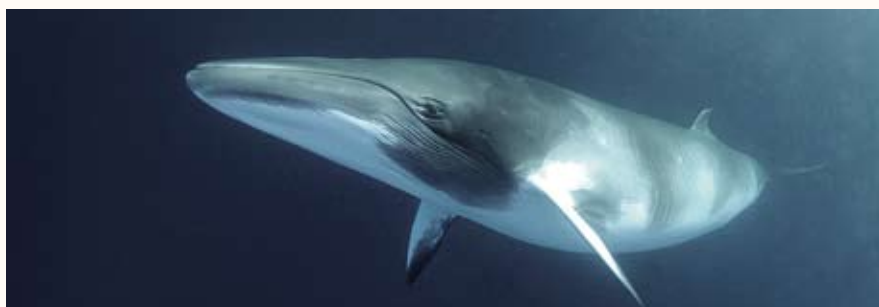
Fotografía profesional, con Kike Calvo

13:00 h Fotógrafo profesional: entre el arte y el negocio . Un recorrido de la mano del fotógrafo de Kike Calvo, sobre los pormenores del fotógrafo profesional. Un repaso de casos reales incluyendo el primer encargo del New York Times, el premio de la categoría de Conservación de Art Wolfe 2010 o como Internet le llevó a la Antártida. Arte, marketing, negocio, pasión, azar y perseverancia. Aventuras y desventuras de un fotógrafo profesional.