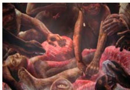
Neandertales y humanos, presentado por Andrés Santos