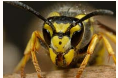
Fotografía macro: artrópodos, de Paco Alarcón