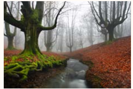
El lenguaje del arte, con José Benito

10.00 h El lenguaje del arte , con el prestigioso fotógrafo de naturaleza José Benito. El mundo de la composición es un abismo al que los fotógrafos se enfrentan una vez superada la técnica. En el arte clásico están las respuestas y sus maestros nos muestran el camino para lograr imágenes que transmiten, que conmueven. Las imágenes memorables no son fruto de la suerte, ni de utilizar un buen equipo, ni del retoque digital, sino del conocimiento. Descubre nuevas formas de mirar y de plasmar la naturaleza desde el conocimiento de los valores del arte.