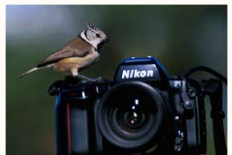
Aventuras y desventuras de un fotógrafo, con Jordi Bas