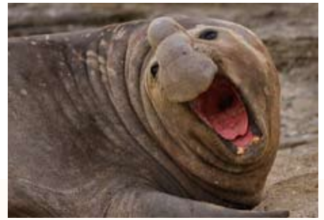
Valdés, tierra de gigantes, Fotografía de Naturaleza Argentina

20:45 h Fotos de fauna desde el otro lado del visor. Aventuras y desventuras de un fotógrafo en la naturaleza , con Jordi Bas. Las fotografías de animales salvajes exigen a menudo quehaceres en los que la técnica y habilidades fotográficas son sólo el último eslabón en un camino lleno de trucos, recovecos e improvisaciones de todo tipo. En esta charla veremos algunos procedimientos usados para poder tener a los animales a pocos metros de la cámara del fotógrafo. Desde pequeñas artimañas que se pueden improvisar un domingo por la mañana en el jardín de casa, hasta largos procesos de preparación que han exigido meses de trabajo antes de poder apretar el disparador. Para todos los públicos: desde el profesional que puede “espiar” cómo trabaja la competencia, hasta el fotógrafo que quiere iniciarse en este apasionante mundo de la fotografía de animales salvajes.