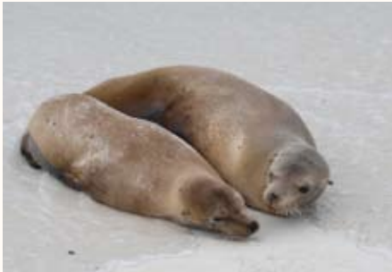
Galápagos, de Meritxell Aragonés