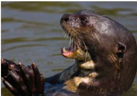
El Pantanal, de Joan Roca