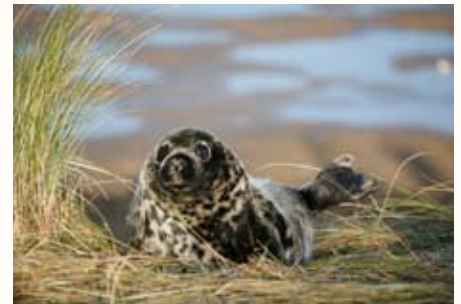
La foca gris, de Mariano Cano

10.45 h -La foca gris en Donna Nook , de Mariano Cano. Todos los inviernos, siguiendo su instinto reproductor, la foca gris acude al santuario inglés de Donna Nook. Situado en la costa oriental inglesa, el enclave constituye un auténtico paraíso para el fotógrafo de naturaleza en esta época. Sin embargo, de la responsabilidad de los propios fotógrafos depende que pueda seguir existiendo.