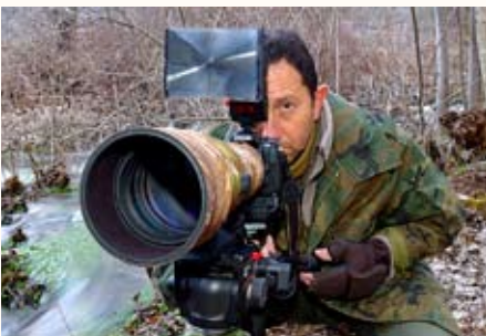
Fotogramas, de José Larrosa